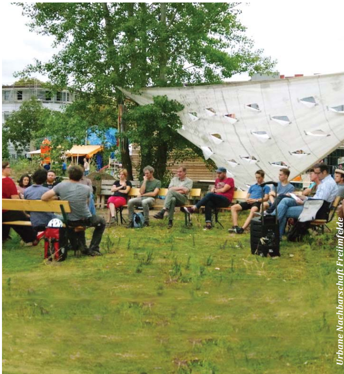
Urbane Nachbarschaft: Freimfelder